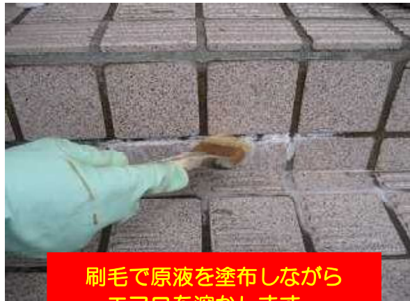
刷毛で原液を塗布しながらエフロを溶かします。