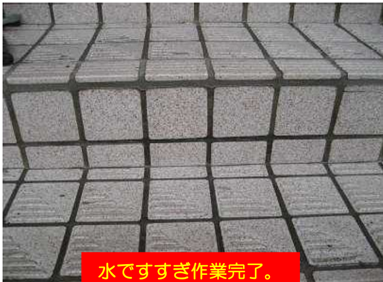
水ですすぎ作業完了。