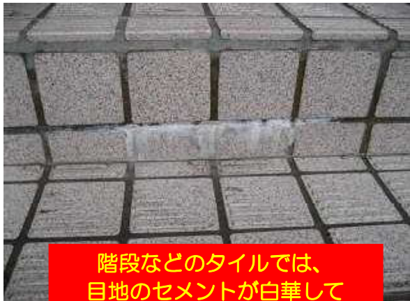
階段などのタイルでは、目地のセメントが白華してエフロが発生。