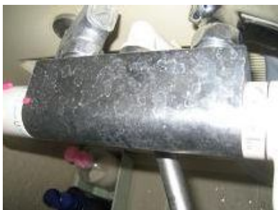
蛇口の写真のような 白いスケールは、 なかなか普通の洗剤では 落ちません。