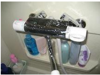
スポンジで表面を洗います。 (キズのつくようなスポンジは 避けてください)