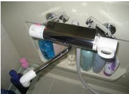
流水でしっかり洗浄して完了です。