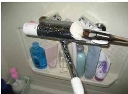
エスカルゴをハケで均一に 塗布し、15分程そのままに おきます。(素材や状態によって 時間を変えてください)