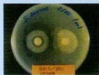
〈黄色ブドウ球菌〉 左のほうに強い抗菌力 (黒い阻止円) が見られる。 右、善玉菌の増殖活動。 左・透明液 / 右・有色液