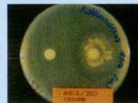
〈シュードモナス菌〉 食品腐敗の原因菌。 右の方に左よりも強い抗菌力 (黒い阻止円) が見られる。 左・透明液 / 右・有色液